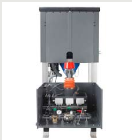
Carbodos, Aktivkohledosierung aus Big Bag

4 E 51) und zeigt bewährte Produkte und wesentliche Neuheiten: